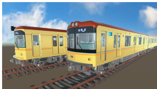
銀座線1000系(標準車)NFTデータイメージ

近年は、社員自ら銀座線車両等の3DデジタルモデルNFTを制作し、NFTマーケットプレイス「Adam byGMO」で販売するなど、「世界にひとつのデジタルデータ」として、お客様のニーズに合わせた新たな魅力、価値を提供しています。