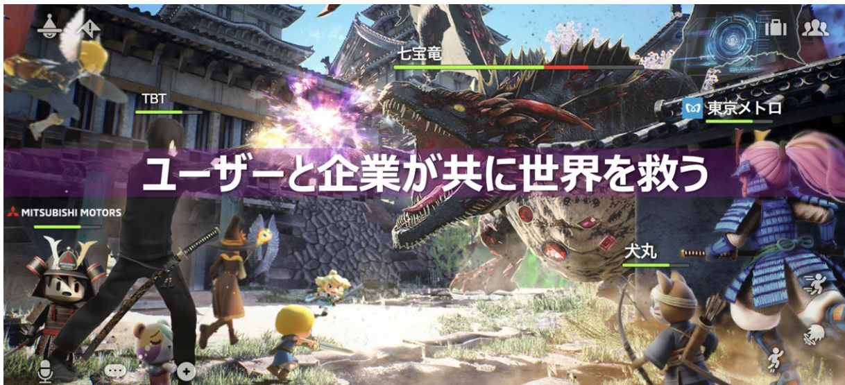
竜宮国のイメージ

「竜宮国」とは JP UNIVERSE が 2025 年に提供予定のアバターで遊べる日本神話をモチーフにしたオンライン RPG です。「ユーザーと企業が共に世界を救う」をキーワードに、様々な現実の要素を取り込むと共に、ゲーム空間内にクリエイターエコノミーと企業プロモーションを統合した経済圏を創り出す挑戦的なサービスです。その技術基盤となる独自ミドルウェア「OwnWorld」の提供を通じて、アジア地域にクリエイターネットワークを構築しながら開発を進めています。